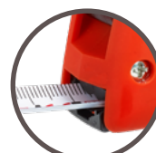
veiligheidsbuffer (alleen versie 5 m)