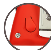
lint met één druk op de knop te stoppen