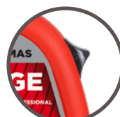
eenvoudig toegankelijke lint-vergrendeling