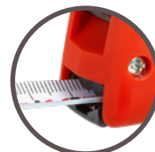
amortisseur (version 5M seulement)