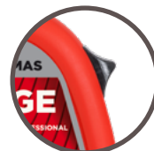
bouton de blocage du ruban facilement accessible