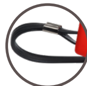
dragonne en ABS