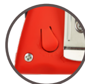
blocage du ruban par simple pression