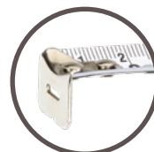
crochet multifonctionnel pour ruban de mètre à ruban