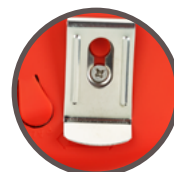
clip en acier pour ceinture