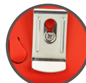
Gürtelclip aus Stahl